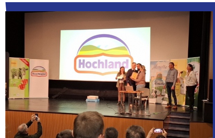
Fot. Konferencja szkoleniowa dla Dostawców Mleka Hochland 21.01.2025

Dzięki takim inicjatywom Hochland wzmacnia kompetencje dostawców i wspólnie z nimi podnosi standardy produkcji mleka.