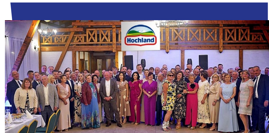
Fot. Gala Konkursu dla Dostawców Mleka 28.08.2025

Działania te wspierają redukcję emisji gazów, poprawiają ekonomikę gospodarstw oraz zwiększają ich odporność na zmienność cen energii.